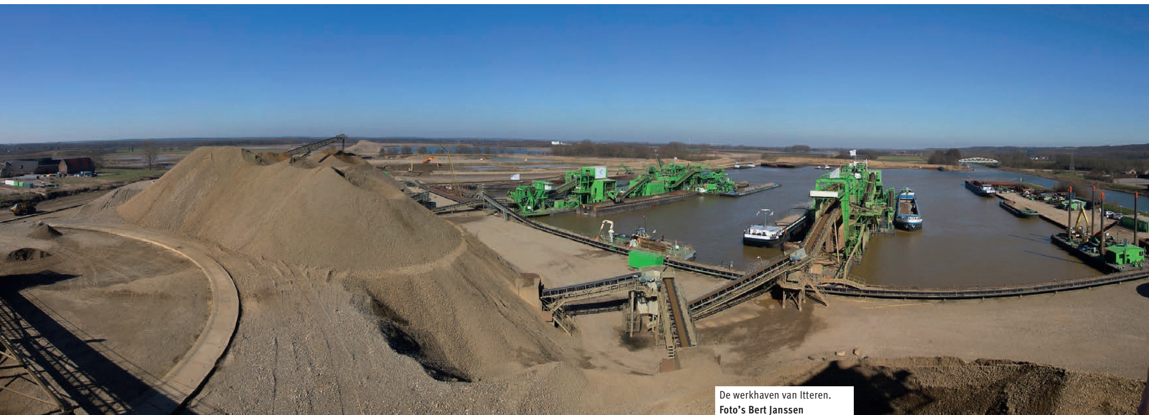
De werkhaven van Itteren.

“Een molenbaas op een baggermolen is als een kapitein op een schip. Ik zorg voor de juiste inzet van de bemanningsleden en ik controleer samen met mijn collega's de kwaliteit van het eindproduct. Wij leveren grind en zand in elke door de klant gewenste afmeting, van 32 mm tot 250 micrometer.”