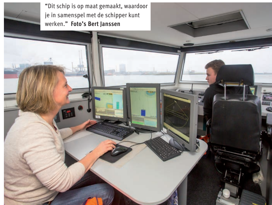
“Dit schip is op maat gemaakt, waardoor je in samenspel met de schipper kunt werken.”

gebied van 1 op 3 bestrijken: bij een diepte van 20 meter wordt 60 meter bodem in kaart gebracht. Paulien: “Het komt dan aan op de stuurmanskunst van de schipper. Voor zich heeft hij een computerscherm waarop hij, net als ik op een van mijn schermen, ziet welk deel van de bodem we al hebben gehad. De stuurmanskunst van de schipper is nodig om het gehele werkgebied te surveyen, zonder lege plekken maar ook niet met te veel overlap. Uiteraard is zijn hoofdtaak dat hij het schip volgens de regels bestuurt en te allen tijde de veiligheid waarborgt.” Goede stuurmanskunst is inderdaad gewenst, want in de vaargeul in IJmuiden varen grote, weinig wendbare, zeeschepen. Net op dat moment doemt vanaf de Noordzee een ander schip van Van Oord op: de steenstorter Jan Steen. De bemanning zwaait enthousiast naar de collega's op het kleine bootje. Op verzoek van de fotograaf manoeuvreert