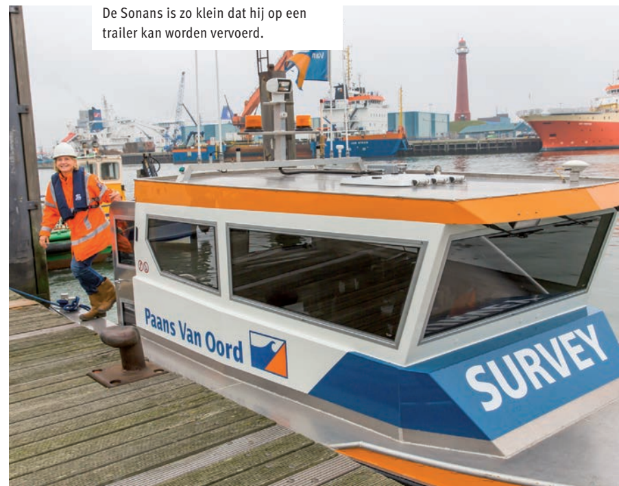
De Sonans is zo klein dat hij op een trailer kan worden vervoerd.