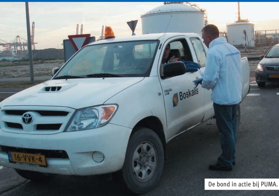
De bond in actie bij PUMA.

FNV Waterbouw stond de afgelopen weken letterlijk én figuurlijk op de stoep van de baggerbedrijven Van Oord en PUMA.